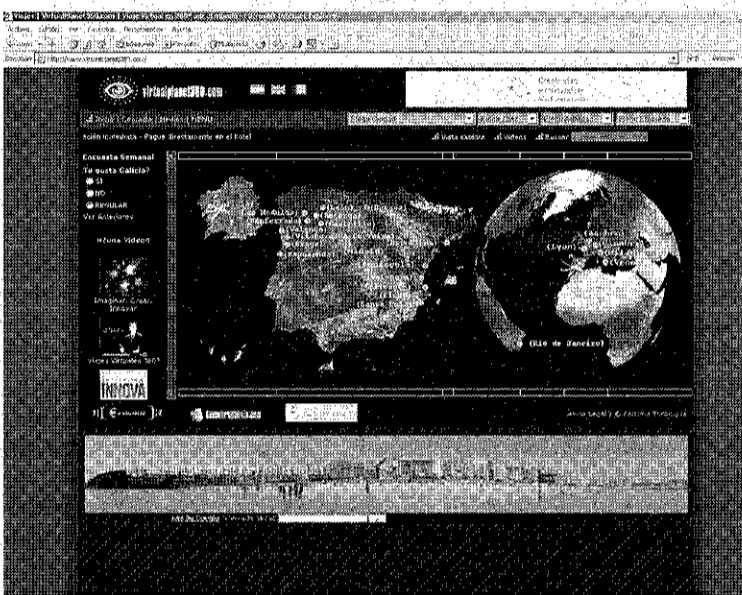
La web permite hacer viajes virtuales por Galicia